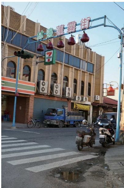
照7-3：林邊蓮霧街 資料說明：圖為位於林邊鄉內之蓮霧大街，蓮霧為林邊鄉重要經濟作物，其帶來之經濟效益，可見一斑。

從民國54年開始，蓮霧逐漸在林邊受到地層下陷影響、土質鹽份較高區域栽種。在一群在地農民不斷的改良下，林邊的蓮霧品質逐漸改善，市場上打出口碑，而有「鹹水蓮霧」之稱。在蓮霧收益遠勝稻米、以及香蕉開始走下坡情況下，越來越多農民轉植蓮霧。在民國63年時，屏東蓮霧種植面積上只佔全國一半，全國亦僅有數百公頃。但到了民國70年時，可謂是屏東蓮霧種植的轉捩點。一方面在種植技術上，開始從粗放式種植轉變成為專業式管理，另一方面蓮霧種植在屏東快速擴散，同時種植的位置也從散布在整個屏東平原逐漸集中到沿海鄉鎮。到了民國70年代蓮霧種植面積已經高達一萬公頃左右，其中屏東就佔了八成，逼近了稻米的耕作面積，成為屏東乃至臺灣最具代表性的經濟作物之一。