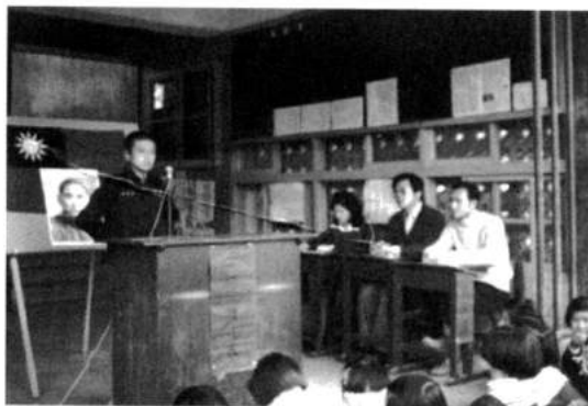
照片3：就讀城光中學二年級時代表參加演講比賽

還親自跟我說伊很優秀。伊當時翻譯古典音樂曲子和旁白都不用自己的名字，伊都是用伊班上同學的名字當作譯者。之後，伊參加社團演出沒時間