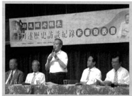
民國95年8月六堆文化研究學會邱連輝老縣長口述歷史紀錄新書發表會