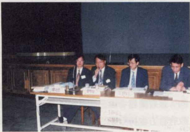
照片7：抱病仍主持第三屆屏東研究研討會

以國外的學術研究，用地方（地名）成為一門學派可以說是少之又少，大概只有芝加哥學派（Chicago School）和法蘭克福學派（Frankfurt School）較為學術所尊崇。例如美國的芝加哥學派（Chicago School），是建立1982年的芝加哥大學社會學系 8 ，發展具有開拓性的都市社會學理論及研究方法，並成為現代社會思想主要運動的中心，包括哲學的實用主義（pragmatism）和象徵互動論（symbolic interactionism）。 9