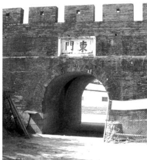
恆春城（東門）